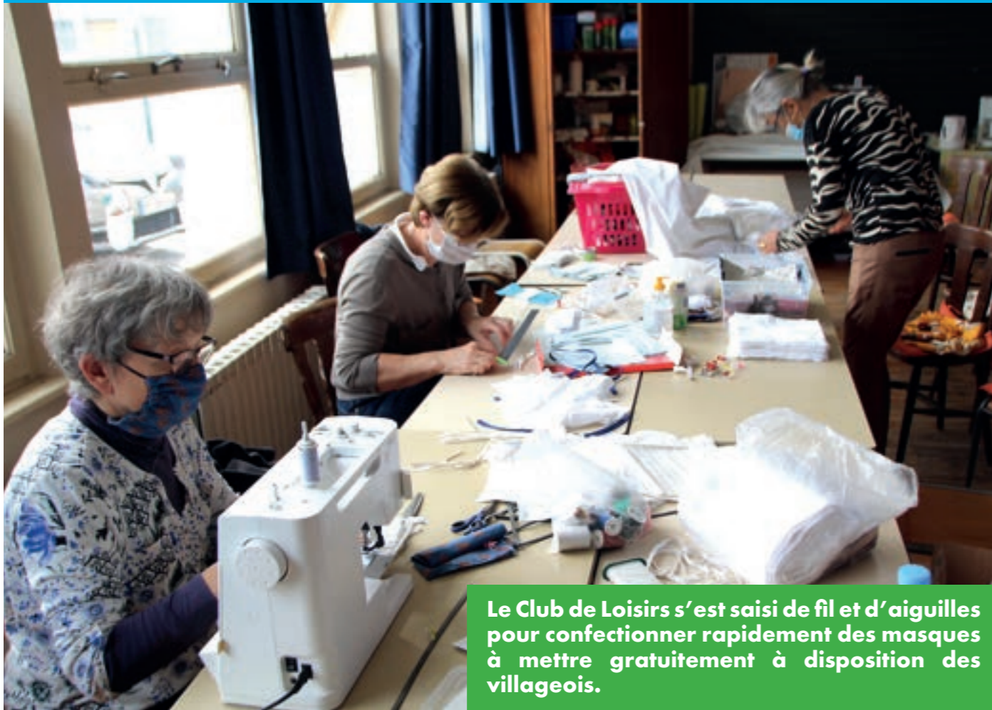
Le Club de Loisirs s'est saisi de fil et d'aiguilles pour confectionner rapidement des masques à mettre gratuitement à disposition des villageois.

Le 16 mars 2020, le président Emmanuel Macron déclarait à la télévision : « nous sommes en guerre ». Il annonçait ainsi le début du confinement de toute la population française et le début du calvaire pour bon nombre de salariés, de familles et d'entreprises.