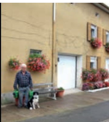
Ci-dessus : Photos d'archives prises avant l'obligation du port du masque.

Directeur de la publication : Bernard Guirkinger, Maire Rédaction : Lisa Neuberger-Sausy avec le concours des élu(e)s et services municipaux Maquette & mise en page : Emmanuel Garbal Tirage : 400 exemplaires (Mars 2021).